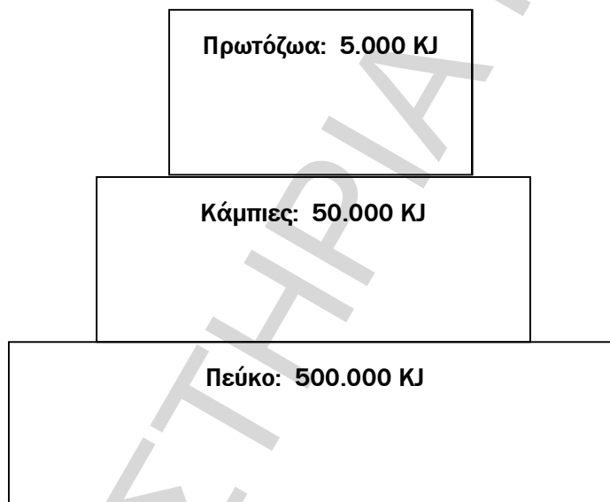
Τροφική πυραμίδα ενέργειας

Σχολικό βιβλίο σελ. 77: Έχει υπολογιστεί ότι μόνο το 10% περίπου της ενέργειας ενός τροφικού επιπέδου περνάει στο επόμενο, καθώς το 90% της ενέργειας χάνεται. Αυτό οφείλεται στο ότι: